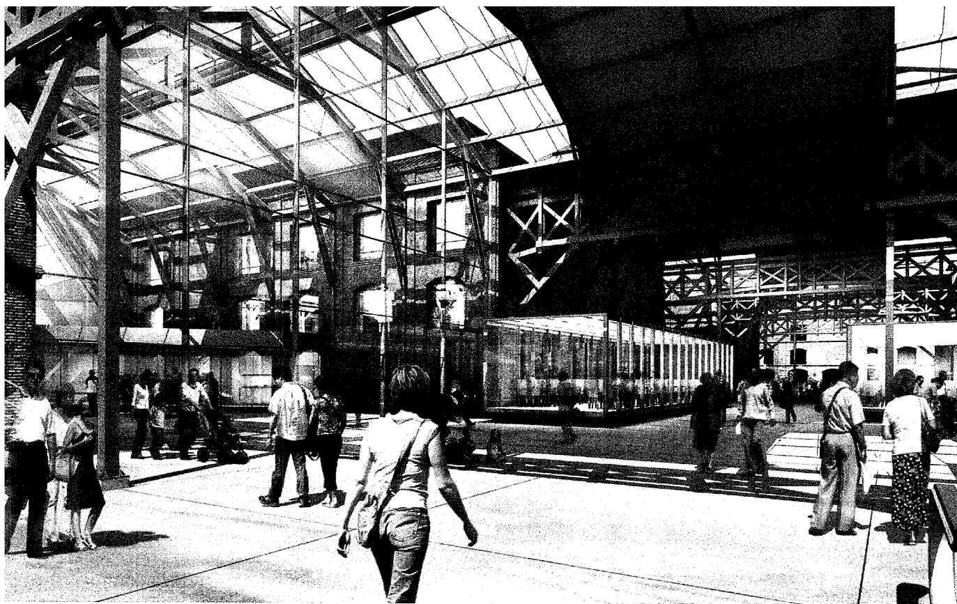
Les Docks Vauban, qui visent les cinq millions de visiteurs en 2010, s'inscrivent dans un vaste projet de réaménagement urbain au sud du Havre.

incroyables au plan architectural », expose Arnault de Giron. Et de citer les piliers en bois apparents chez Saturn, ou la hauteur exceptionnelle du hall d'entrée des salles de cinéma.